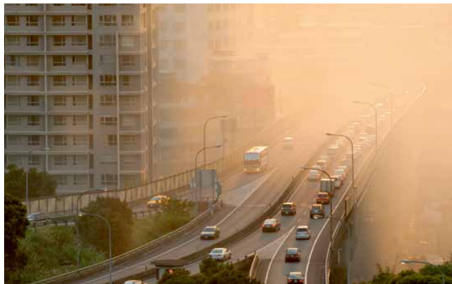
PWD52非常适用于气象与环境观测网络。