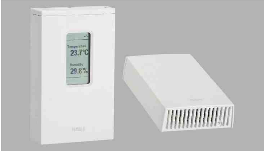
HMW90系列温湿度变送器专为要求苛刻的暖通空调(HVAC)应用而设计。